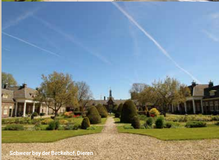
Schweer bey der Beckehof, Dieren