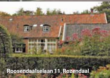
Roosendaalselaan 11, Rozendaal