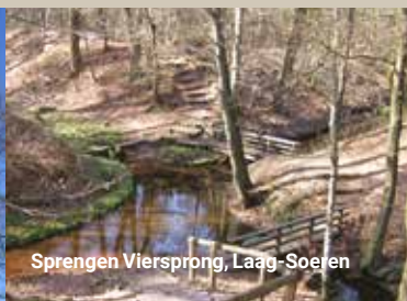
Sprengen Viersprong, Laag-Soelen