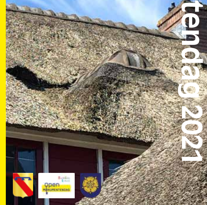
Strooien Dorp, De Steeg