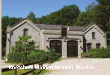
Koetshuis Midden Heuven, Rheden

Welkom (terug)! Rheden en Rozendaal hadden in 2020 door corona geen Open Monumentendag en ook dit jaar is nog niet alles gewoon. We leggen de nadruk op het buitengebeuren en er zijn wandel- of fietsroutes langs monumenten. Daarbij geldt: Mijn dorp is jouw dorp! We vragen alle bezoekers om extra voorzichtig met elkaar om te gaan, zeker waar particulieren en organisaties hun monument wel openstellen. Het Comité bedankt alle mensen die meewerken bij voorbaat hartelijk!