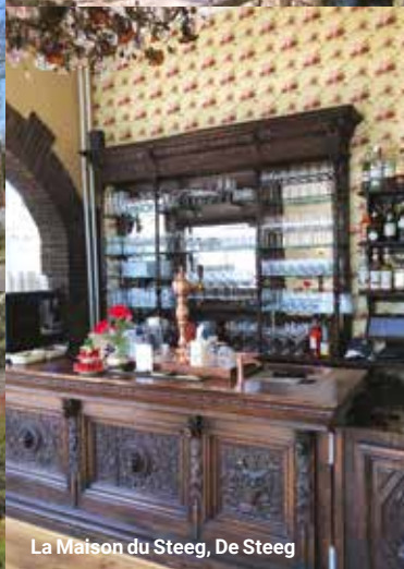
La Maison du Steeg, De Steeg