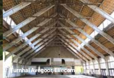
Turnhal Avégoor, Ellecom