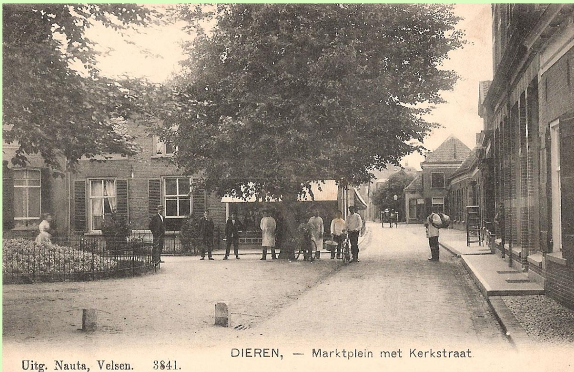
Uitg. Nauta, Velsen. 3841.