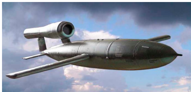
V1 ook wel Vergeltungswaffe 1

Op een bepaalde nacht, in het najaar van 1944 werden we 's nachts wakker van een geweldig lawaai in de lucht. We hadden op die dag gedorst en de dorsmachine met de tractor stonden nog bij de eenroedige berg, op de plaats waar nu het eind van de varkensschuur is. In eerste instantie dacht ik dat iemand er met de trekker vandoor ging. Wat we zagen was een soort vliegtuig, laagvliegend en van achter vuur uitbrakend onder veel lawaai. Het was de bedoeling dat zij terecht zouden komen op Antwerpen, want dat was toen de belangrijkste aanvoerhaven van de geallieerden. Ze werden op verscheidene plaatsen gestart, waaronder ook in het bos bij Joppe. Ik heb later zo'n start installatie gezien. Er waren echter nogal wat mislukkingen; die kwamen niet zover. Het was opmerkelijk dat er erg veel neergekomen zijn bij de heuvels van de Veluwe, net of ze daar niet overheen konden komen (Geitenberg, Schaddeveld enz.)