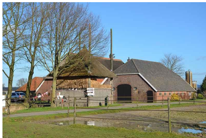
De Burgershoeven 2016

Ik vraag mij af waar te beginnen. In 1940 was ik soldaat en de vijf dagen oorlog van 10-15 mei 1940 heb ik ook meegemaakt en ik zou er heel wat van kunnen vertellen, maar dat is nu niet de bedoeling, misschien doe ik dat later