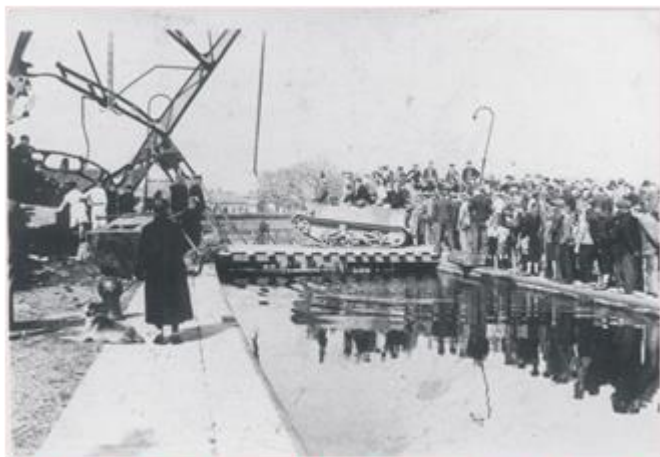
Noodbrug bij de sluis Spankeren/ Dieren gemaakt door de bewoners

was, het waren een aantal carriers met metalen rupswielen die dat lawaai veroorzaakten. Er werd niet geschoten, want in de nacht van 15 op 16 april waren alle Duitsers uit Olburgen, Doesburg en verdere omgeving teruggetrokken richting Apeldoorn. De Duitsers hadden de toren van de kerk van Doesburg de vorige dag opgeblazen, men zei later dat dit had gediend om aan alle Duitse posten te doen verstaan dat het uur van vertrek was aangebroken. De grote slanke toren was n.l. overal in de omtrek te zien. De Canadezen konden niet verder dan het kanaal want de brug was opgeblazen, men heeft in korte tijd een noodbrug gemaakt over de sluiskommen en toen konden de voertuigen Dieren binnen komen. Ondertussen was Dieren van de andere kant bevrijd. De Engelsen kwamen met grote tanks vanaf Arnhem, maar niet over de weg maar door de bossen via de Geitenberg kwamen ze Dieren binnen.