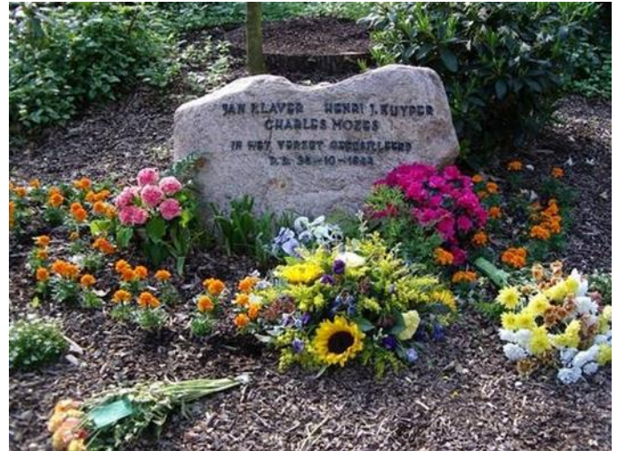
Gedenkteken voor de drie op 25 oktober 1944 gefusilleerden aan de Pinkenbergseweg. vóór de Geërfdenbank

In 2014 hebben de Velsche Woudlopers en de Olmen het monument geadopteerd om zo de jeugd actief te blijven herinneren aan de oorlog. De scouts onderhouden het monument wat veel betekent voor de nabestaanden.