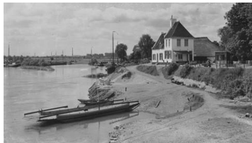
Het voormalige Rhedens Veerhuis met de veerboot

Op het achterste stuk grond stonden fruitbomen, een kippenhok en was de moestuin.