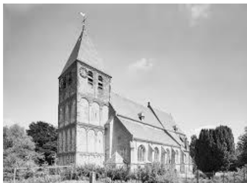
Dorpskerk van Rheden