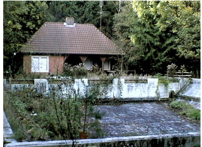
Het verwaarloosde zwembad vlak voor de afbraak