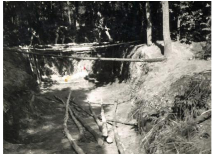
Restant onderduikers hol, Laag-Soeren