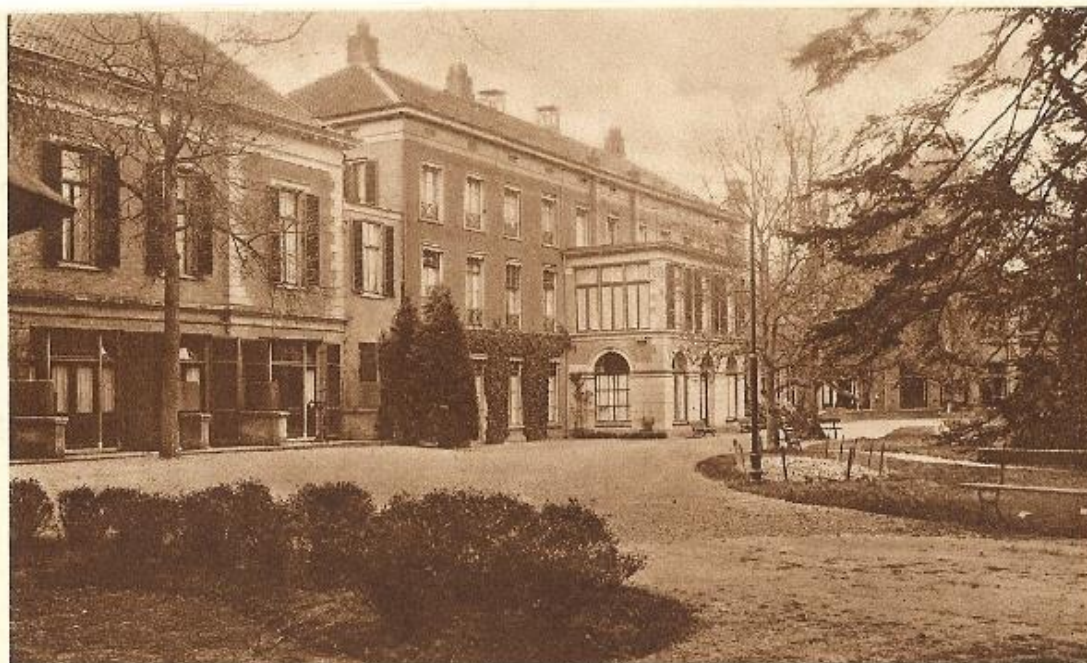
Groet uit Laag Soeren,