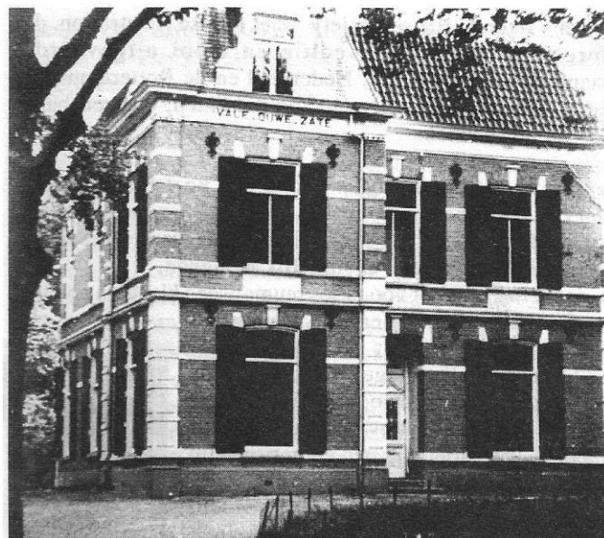
Woonhuis van fam. Van Heusden

De eigenlijke patiënten zaten bij elkaar, luisterden naar de radio en voerden opgewonden gesprekken. Mijn zusje en broertje (toen bijna 8 en nog 4) werden beziggehouden door een oude dame, wie geen moeite te veel was met voorlezen en spelletjes doen. Tot en met 9 mei had ze zich te zwak gevoeld om wat dan ook te ondernemen! Eén patiënt, een meneer van omstreeks 40, reserveofficier, hield vele betogen. Schrijver dezes, toen net 13, ging na een paar uur met vriendje Berend Bosman eropuit om te kijken, welke bruggen over het kanaal waren opgeblazen. Interessant! We keken steeds naar de lucht. Zouden we beschoten worden? Na mijn terugkeer bracht mijn vader me zeer duidelijk bij, dat hij dergelijke blijken van avontuurlijkheid niet waardeerde. Vier oorlogsdagen volgden elkaar op, zonder dat Soeren direct iets merkte van gevechten. Wel is een groep Nederlandse soldaten gekomen, die afgesneden was en richting Utrecht wilde. Mannen uit het dorp gaven burgerkleren aan hen, de uniformen werden verstoppt in het bos en mijn vader gaf de aanvoerder, een luitenant, onze goede stafkaarten van de bossen. Ze waren van de Topografische Dienst uit 1936. De officier had alleen een oude uit 1926, waar b. v. de Bloemersweg nog niet op stond.