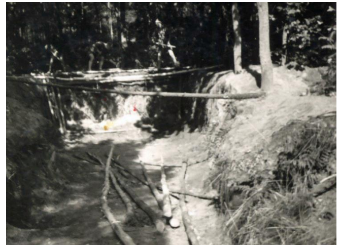
Restant onderduikers hol, Laag-Soeren