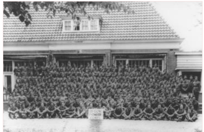
Soldaten van The Royal Pioneer Corps werden in 1945 op het landgoed gelegerd