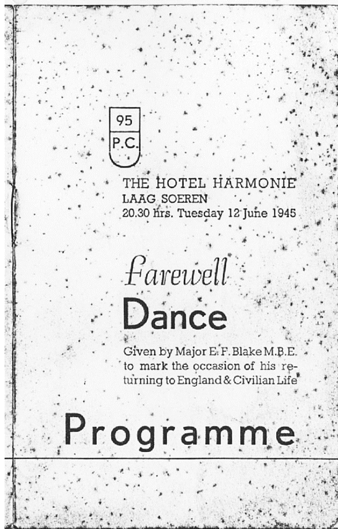
Farewell dance in de harmonie 12 june 1945