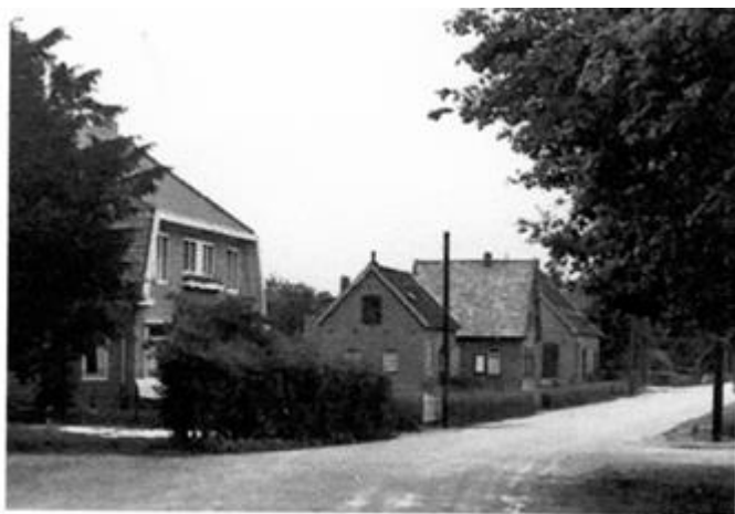
Zonnehoek/1945, Harderwijkerweg 13a

Engelse sigaretten. Ik weet het merk nog: "Senior Service". Dat was wat anders dan gedroogde rabarber! Je werd er wel woazig van als je over de longen rookte".