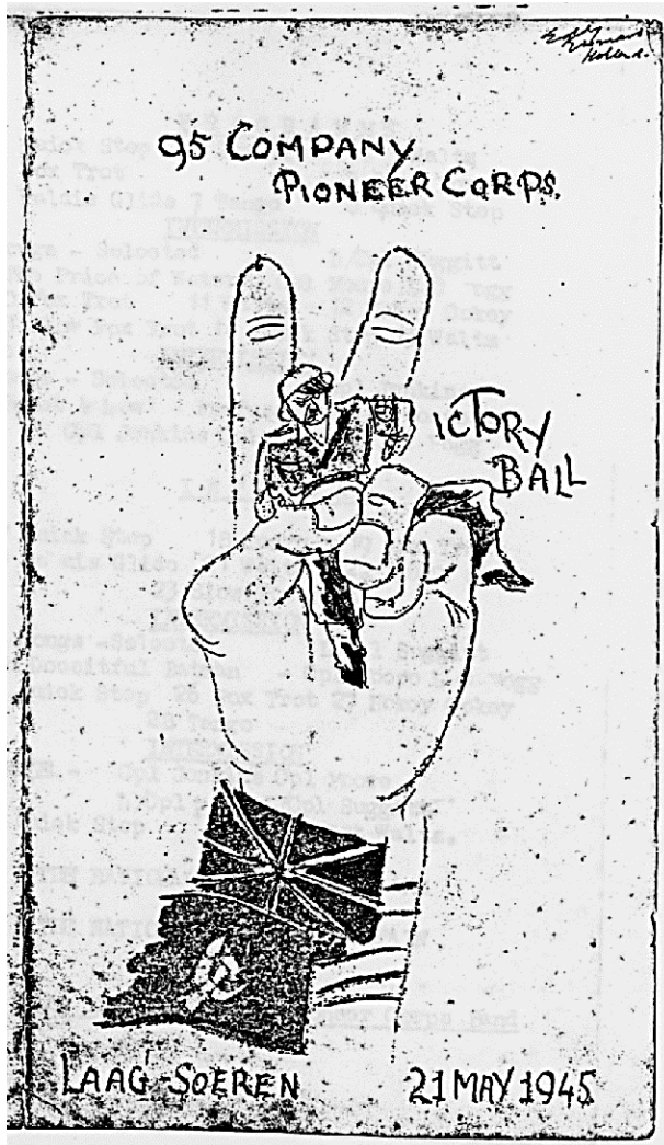
H6-09 Victorie Ball 21 mei 1945