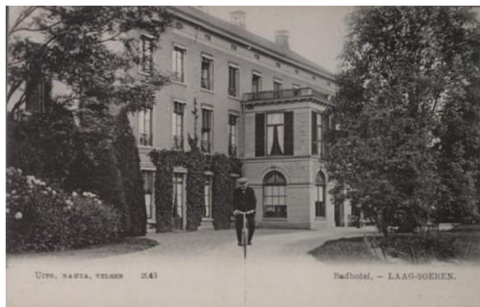
Bethesda/ Soeria/ Landgoed Laag-Soeren

'Met groote gastvrijheid hebt Gij ons opgenomen in Uw woningen en gezinnen, vaak zelfs uw voorraden met ons gedeeld. Nooit zullen wij vergeten, hoe Gij ons, zonder aarzelen, hebt geholpen in de nood... Wij zagen de gouden