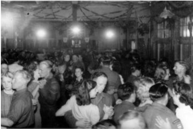
Bevrijdingsfeest op Soeria

&Sweet Music bij the Gipsy Orchestra &Programme: