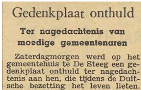
Arnhemsche courant 7-5-1946