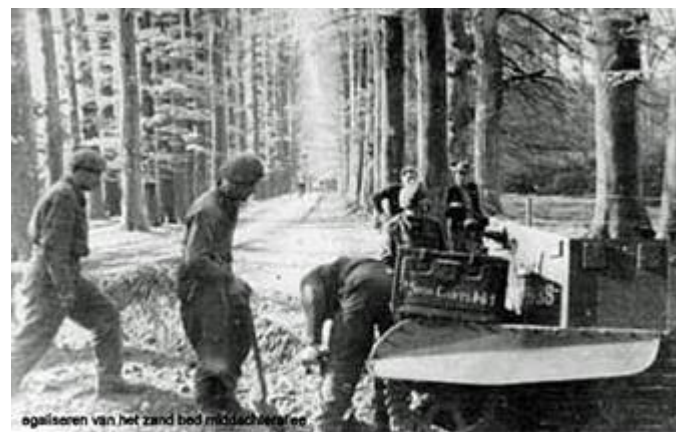
Middachter-Allee Canadese engineers