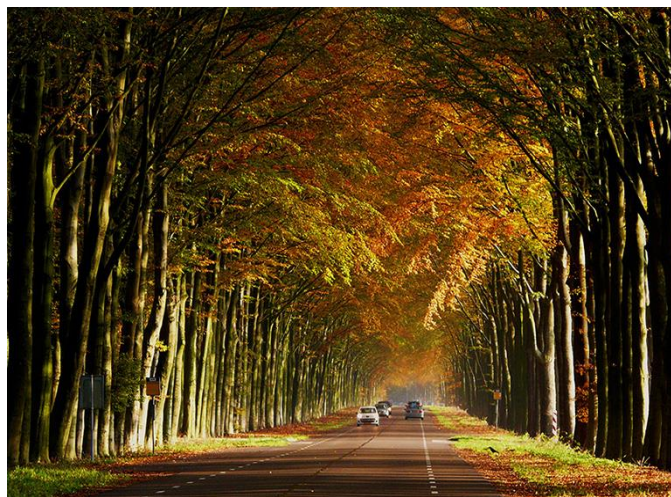
De Middachter Allee laat zich in de herfst van haar allermooiste kant zien – Foto: ©Louis Franje november 2011