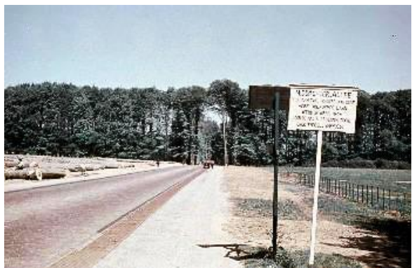
Bord in de Middachterallee met aanklucht april 1945

Dit artikel is eerder verschenen in A&H 202