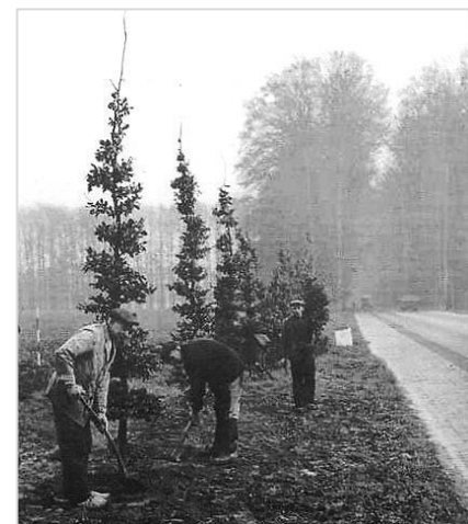
Herplant Middachter Allee, 1948