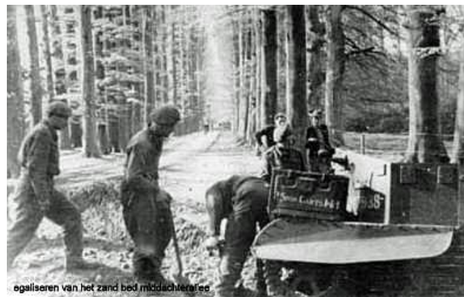
Middachter-Allee Canadese engineers