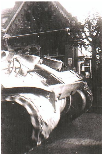
Sherman voor Diepesteeg 14

Zo kwam er een overzichtelijke lijst boven van alle sneuvelden op 16 april 1945 in Nederland. Tussen de overledenen stonden op 16 april 1945 twee 'sappers', sappeurs in goed Nederlands, een categorie genisten met hun specialisatie, zoals je ook pontonniers en mineurs hebt. Twee personen die inderdaad bij de Engelse genie zaten: Royal Engineers.