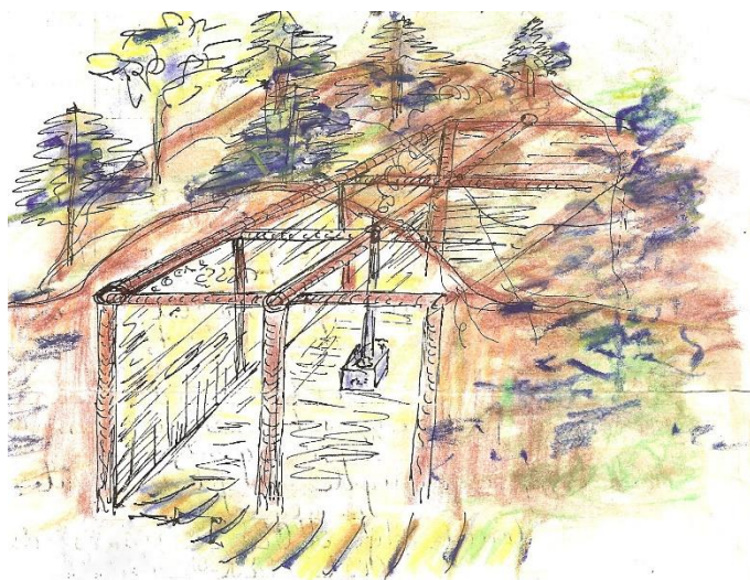
ONDERGRONDS VERBLIJF MET BEPLANTING LANDGOED MIDDACHTEN "DE STEEG"