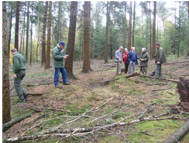
Huidige plaats van het onderduikershol

landgoed. Na een korte zoektocht werd dankzij de terreinkennis van de beheerder het onderduikershol gevonden, enige honderden meters verder dan het Douglas perceel vlak bij de Duivelssteen. Met een metaaldetector werden het onderduikershol en de twee andere hollen in de buurt afgezocht. Na enig speurwerk werden er inderdaad spulletjes gevonden die duidelijk toebehoorden aan de gebruikers van de hollen, o.a. asfaltpapier, kolen en aluminium doosjes van ESBIT-spiritusblokjes die waarschijnlijk gebruikt zijn om eten mee te koken.