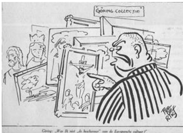
Göring als kunstrove