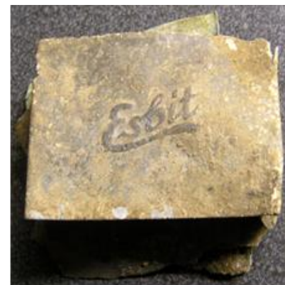
Restant doosje voor spiritusblokjes

landgoed. Na een korte zoektocht werd dankzij de terreinkennis van de beheerder het onderduikershol gevonden, enige honderden meters verder dan het Douglas perceel vlak bij de Duivelssteen. Met een metaaldetector werden het onderduikershol en de twee andere hollen in de buurt afgezocht. Na enig speurwerk werden er inderdaad spulletjes gevonden die duidelijk toebehoorden aan de gebruikers van de hollen, o.a. asfaltpapier, kolen en aluminium doosjes van ESBIT-spiritusblokjes die waarschijnlijk gebruikt zijn om eten mee te koken.