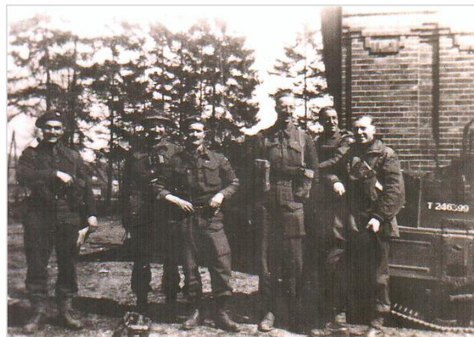
De Majoorsfoto is gemaakt tegen de gevel van de lagere school in De Steeg. De majoors maakten allemaal deel uit van de staf van het bevrijdende Britse legeronderdeel.

Op 18 april 2015 – toen de jaarlijkse Markt-op-Steeg werd gehouden – startte de zoektocht op internet. Via de site van de organisatie die de laatste rustplaatsen van alle slachtoffers van die wereldwijde inzet gedurende twee wereldoorlogen beheert – Commonwealth War Graves Commission – is er een keurige zoek-functie op datum en land.