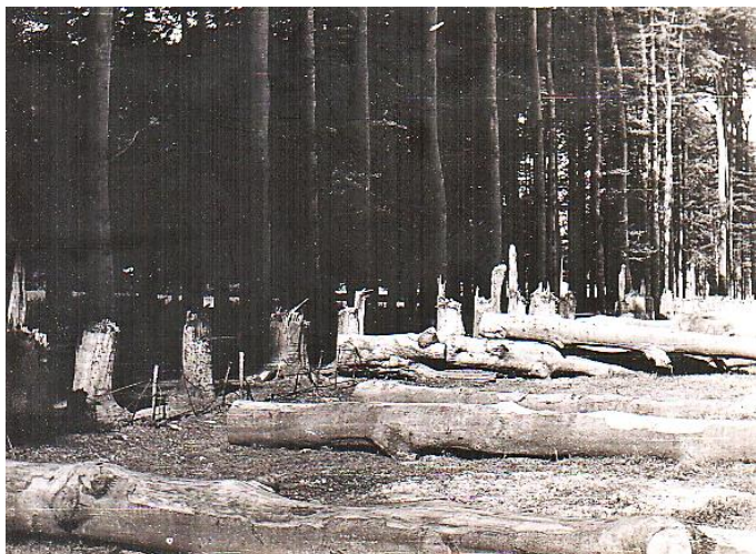
De sporen van zinloze vernielzucht, de eens beroemde Middachter Allee