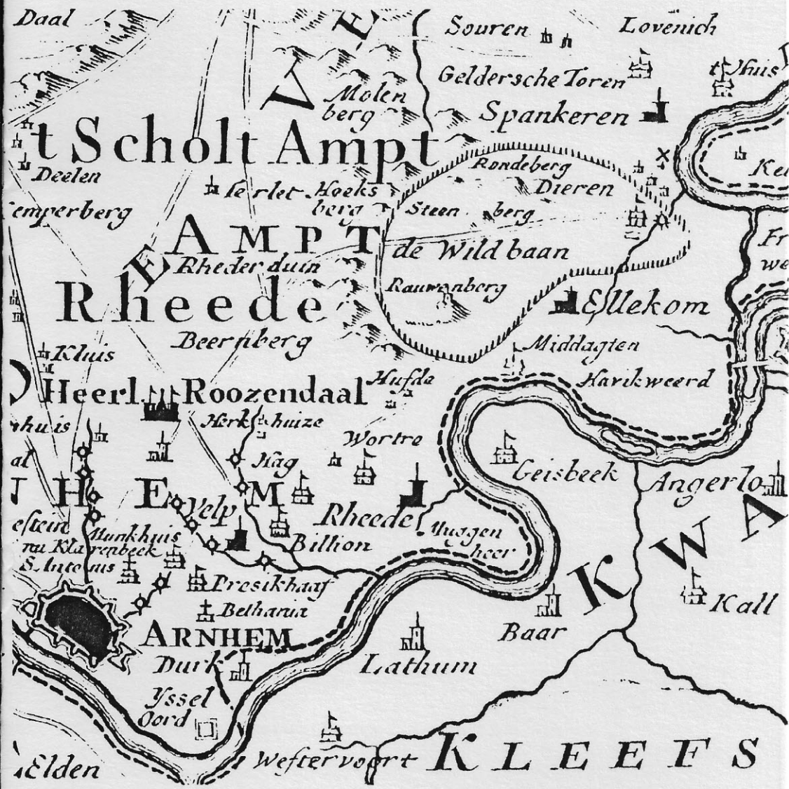
MEDEDELINGEN VAN DE OUDHEIDKUNDIGE KRING "RHEDEN - ROZENDAAL"