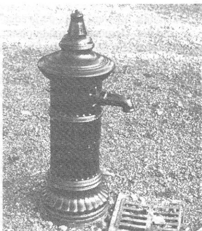
De Fabiuspomp geplaatst bij de Oude Jan foto 1982

Velp. Door de Commissie die zich heeft gevormd om gelden bijeen te brengen ten einde een stichting in het leven te roepen ter eere aan de nagedachtenis van wijlen onzen doctor Fabius, heeft nu definitief besloten een pomp in de Broekstraat al hier te plaatsen, waardoor de bewoners gratis water van de waterleiding zal worden verschaft.