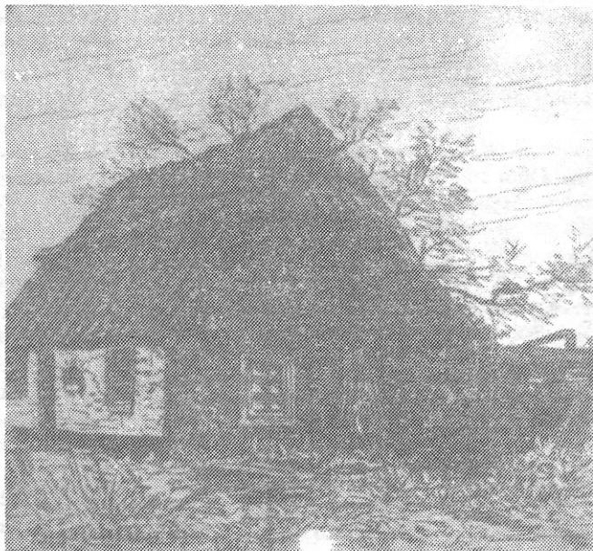
De papiermolen aan het Kaarsenmakersgat